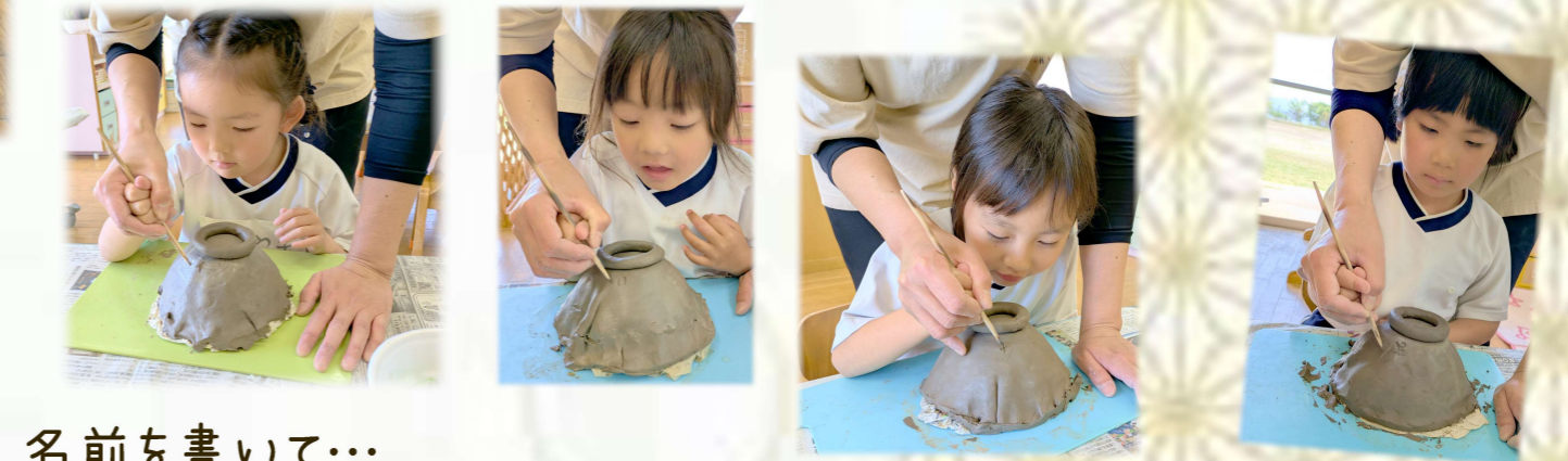
名前を書いて... 出来上がるのが楽しみ！