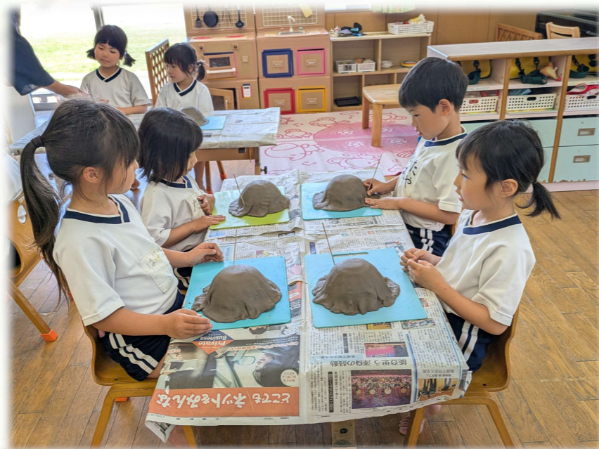
余分な粘土は竹串でカット！！